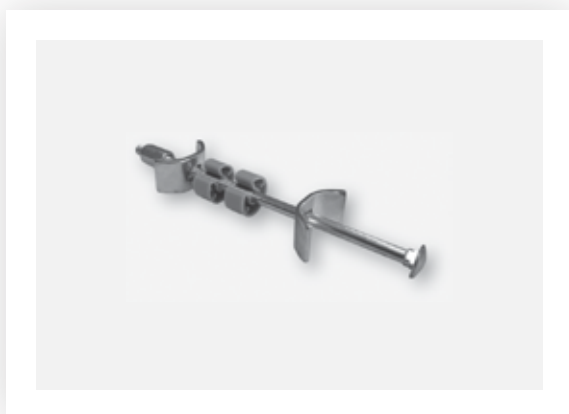
Vijak za spajanje delovnih plošč