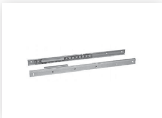
Kroglično vodilo za raztegljive mize